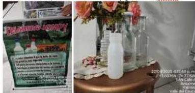
6. Aracely González, transformación de residuos orgánicos en bioinsumos (Arauca)