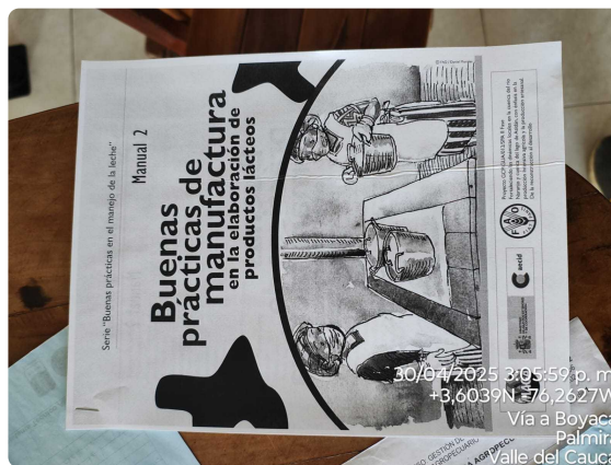
CAPACITACIONES EN BPM A LOS GESTORES DE PROYECTO

ACTFO-035 Versión 06 30/09/2022 Página 4