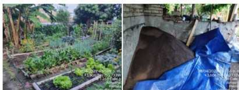
7. Nelly Castaño, Transformación de leche en postres LOS DULCES DE NELLY (La Buitrera).