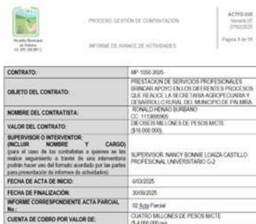
ENTREGA INFORME DE AVANCE ACTFO-035